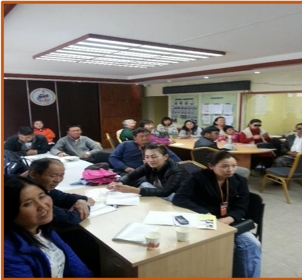
Итгэлт бүтээмж төв /Баянзүрх дүүргийн 10-р хороо/