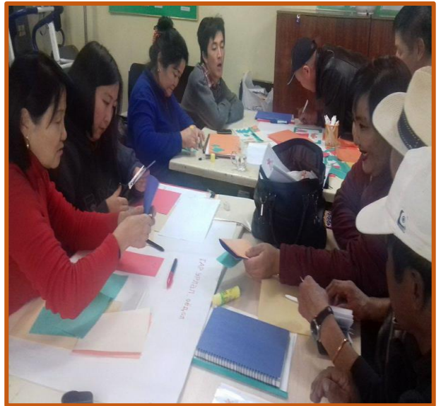
Тайжийн удам-Дэвжих ирээдүй БИТ /Баянгол дүүргийн 3- хороо/