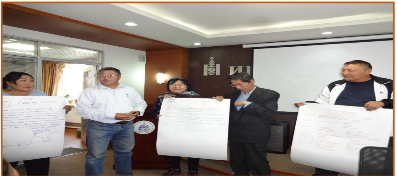
Стармүүн Сургалтын төв /Баянзүрх дүүрэг/

Сургалтын явцын хяналтаас дүгнэлт хийхэд Хөгжлийн бэрхшээлтэй иргэдийн БИТ, “Итгэлт бүтээмж, “Стар мүүн” зэрэг сургалтын байгууллагууд хороодын Засаг дарга нар, дүүргийн ХБИХ-той нягт уялдаатай ажилласнаар ирц оролцоо сайтай үр дүнтэй сургалтыг зохион байгуулж байв.